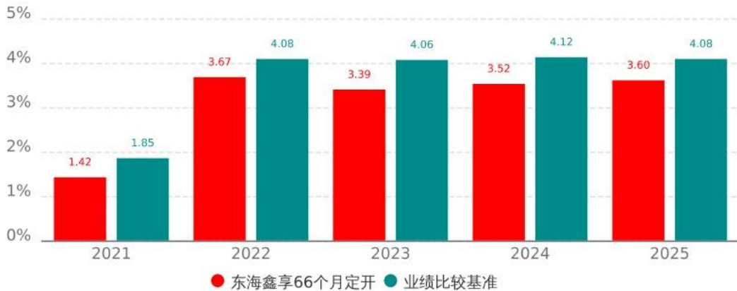
基金的过往业绩不代表未来表现，数据截止日：2025年12月31日

本基金合同于 2021 年 7 月 19 日生效，合同生效当年按实际存续期计算，不按整个自然年度进行折算。业绩表现截止日期 2025 年 12 月 31 日。基金过往业绩不代表未来表现。